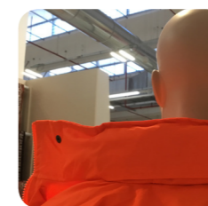
Cappuccio richiudibile nel collo